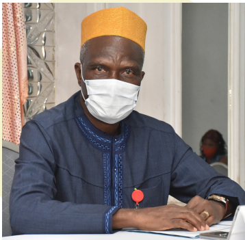
Pr Maxime da Cruz, Rector de l'Université d'Abomey Calavi, principale institution, Bénin

« Le projet DSSR-BJ vise à contribuer à l'accès universel à la santé, y compris aux droits sexuels et reproductifs pour tous les adolescents et les jeunes du Bénin, de manière équitable et inclusive. L'éducation en matière de santé sexuelle et reproductive est restée longtemps un sujet tabou, ce qui a conduit à la marginalisation ».