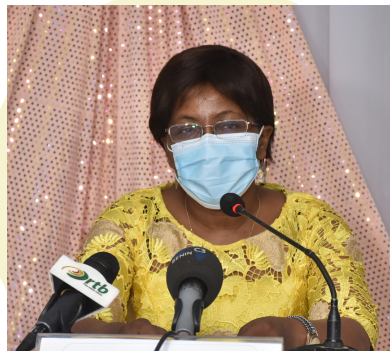
Professeur Eleonore Yayi-Ladekan Ministre de l'Enseignement Supérieur et de la Recherche Scientifique, invitée d'honneur

« Le projet DSSR-BJ vise à contribuer à l'accès universel à la santé, y compris aux droits sexuels et reproductifs pour tous les adolescents et les jeunes du Bénin, de manière équitable et inclusive. L'éducation en matière de santé sexuelle et reproductive est restée longtemps un sujet tabou, ce qui a conduit à la marginalisation ».